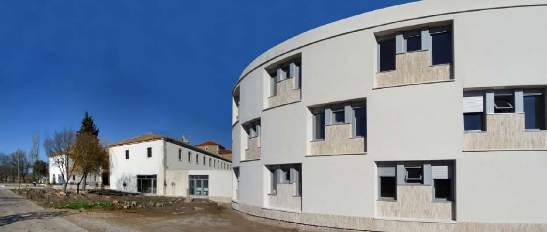
Új és régi - a szerzetesnővérek új szállóépülete az egykori dormitórium mellett

talajt friss érintésével megtermékenyítő nyári zápor, úgy helyezkednek el az eltérő méretű és magasságú épületelemek a történeti épület-együttes körül. Így megmarad a kolostorudvar köré elhelyezett épületek kompakt zártsága, melyet az új épületek szabad térbeli kompozíciója a zárandókok érkezése felőli oldalon érzékenyen továbbsszó. Az enyhe lejtésű domboldalból adódóan így a templom kimagasodik, és az alatta elterülő érkező felület a zárandókok fogadására alkalmas köztérburkolattal vezet tovább az új épülettömegek adta kompozíciót. Az íves vonalvezetésű támfalak lépcsők által tagolt több térszínre tagolják az érkezt, újabb-és-újabb feltárlását adva az épületegyüttesnek. A monostor-kerület bejárati kapujánál a kerítésfalba rejtetten találhatóak a mosdók, és közvetlenül a bejáratnál a hosszabb lelkigyakorlatra érkezők szállásépülete.