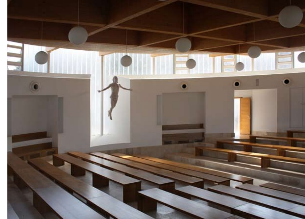
Az új kápolna a zárandókok és a szerzetesek együtt imádkozása céljából jött létre

A Jézus Közössége monostor egyszerre nyitott és zárt életének jól strukturált egységét hozta létre Eduardo Delgado Orusco és tervezőtársai. Kompakt elrendezés és szabad alaprajzi rendszer jól adagolt találkozásai jött létre egy új közösségi térszemlélet szolgáltatásban, ahol a szigorú szerzetesi élet a zárandókok lelki ápolásában teljesedik ki. Az égből érkező esőcseppek szimbolikus kompozíciójának olvasatát látjuk, egy új közösségi aktivitás személyes építészeti megnyilvánulását.