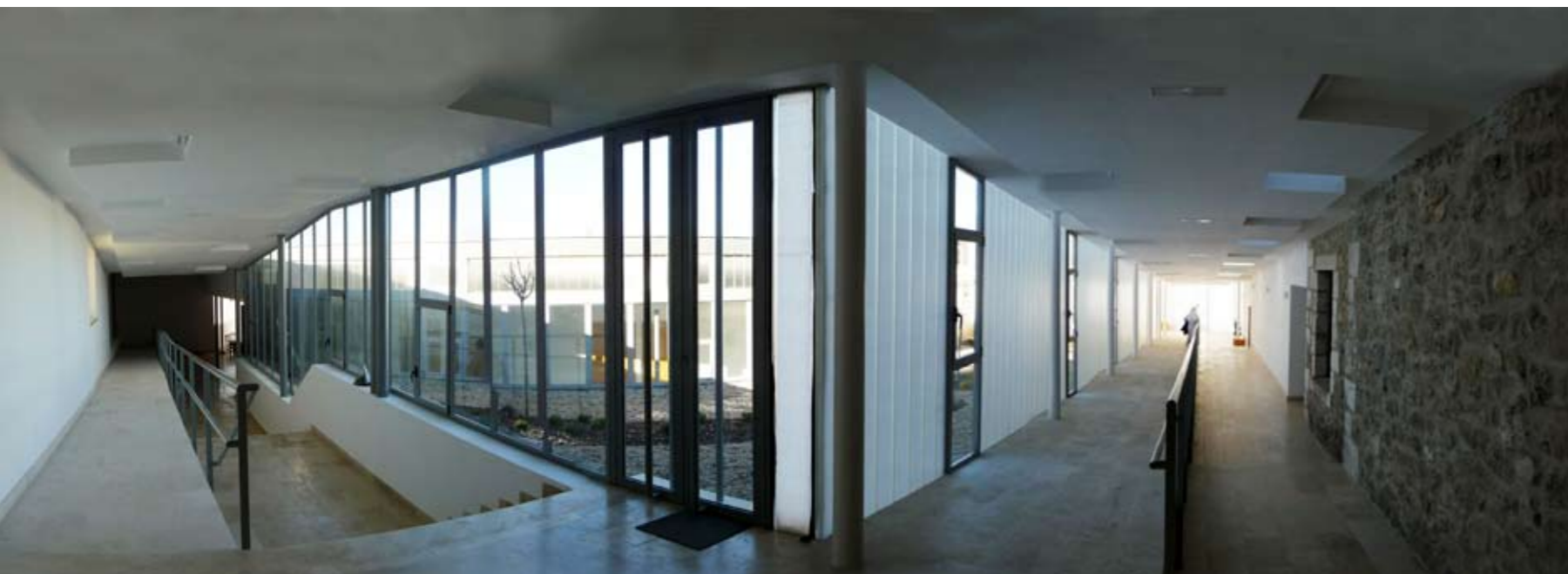
Átlátások: közlekedőből átriumon át

A differenciált területhasználat tehát a monostor belső életének zárandókatok felé történő kommunikatív kiegészítésében fogalmazódott meg úgy, hogy elemeire bontották a tervezők a funkcióegységeket. Minden új téri igény (akár csak a szerzetesi cellák jelentős számú bővítése) önálló épületbe került. Így sikerült elérni, hogy a valójában hatalmas bővítés nem nyomja el a történeti épületek természetes kompakt kompozícióját. A kör alaprajzok adta markáns tömegek kimért homlokzatkezelése és az egyes elemek egymáshoz való viszonyát jól komponáló építész az összekötések alkotta téröblökkel és a kialakuló átriumokat övező folyosókkal további izgalmas téri hatásokat hozott létre. A nyugodt anyaghasználatot (vakolt homlokzatfelületek, természetes köbökkel) puritán de nagyon célszerű nyílászárók gazdagítják (selymesen átsejtlő kopilit-üveg falak, precíz fém nyílászárók). A közlekedőfelületeiben racionális kapcsolódásokat az épületelemek nagyon feszes alaprajzi rendszere teszi kompakttá.